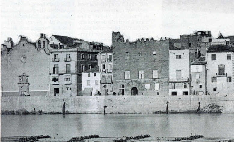
El Palau Oliver de Boteller a la façana fluvial.