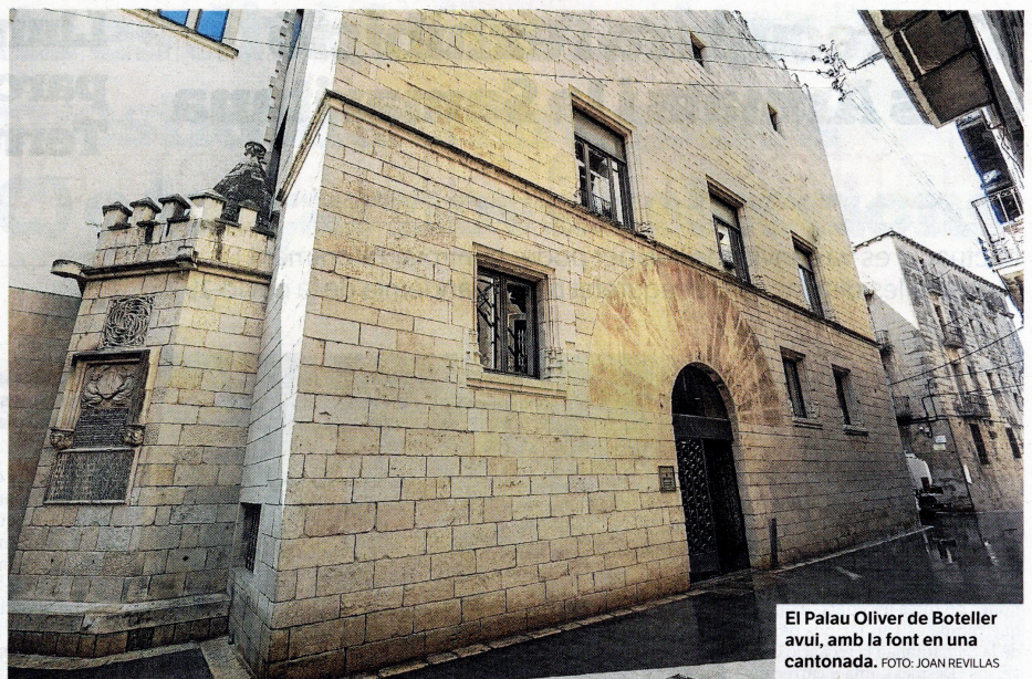
El Palau Oliver de Boteller avui, amb la font en una cantonada.