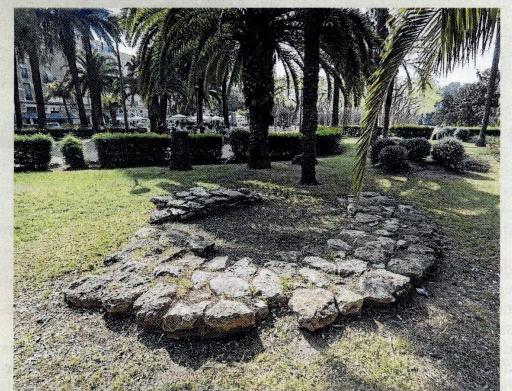
Restes dels fonaments de la basilica.

seva història. I en el trasllat, a més, sovint es perden elements», remarca Curto.