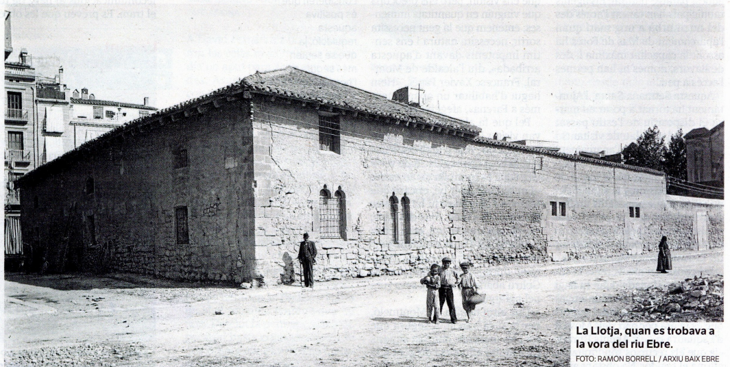
La Llotja, quan es trobava a la vora del riu Ebre.