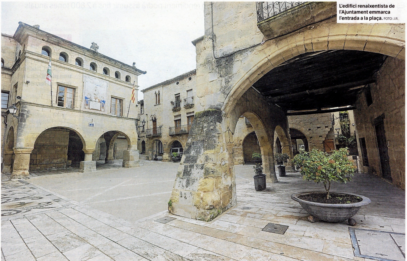
L'edifici renaixentista de l'Ajuntament emmarca l'entrada a la plaça.