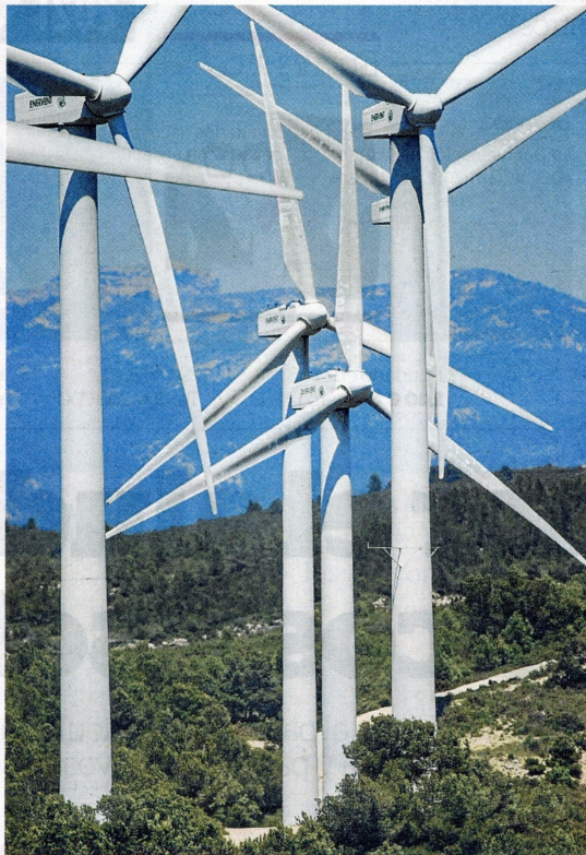
Parque eólico Les Colladetes, en El Perelló.