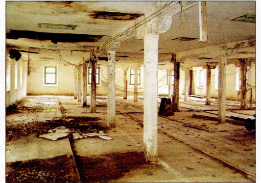
El full on es recull la sentència condemnatòria del jutjat militar de Castelló i una imatge d'arxiu de l'antiga presó, un cop tancada.