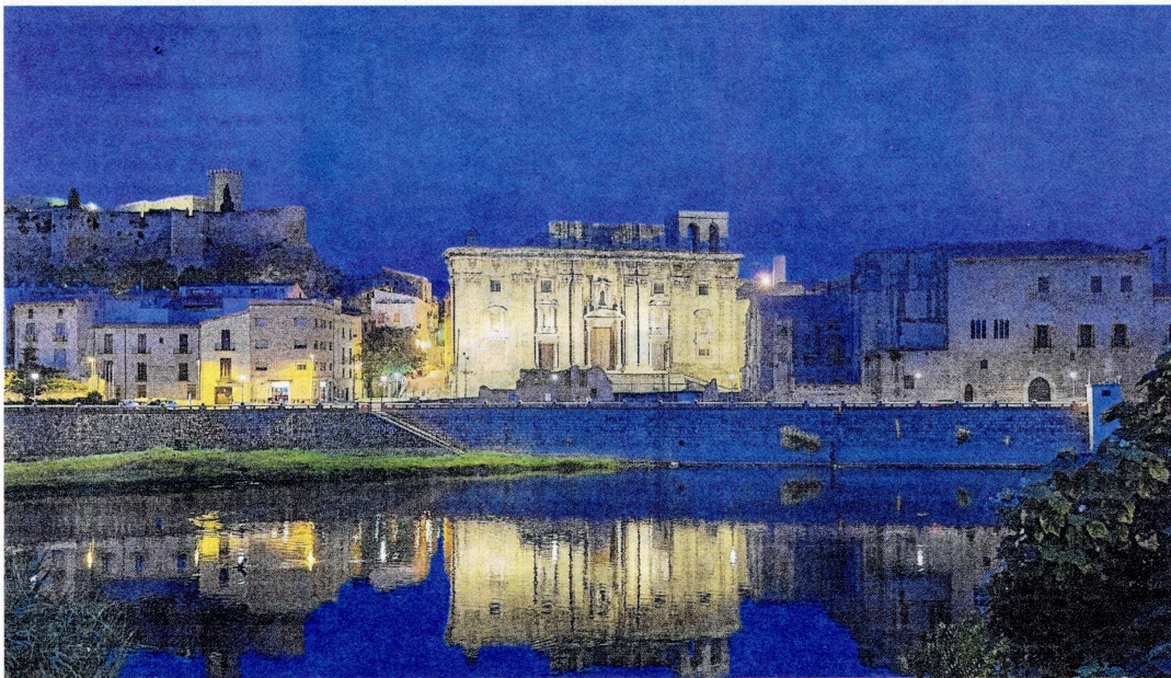
El pla anima a convertir Tortosa en una ciutat turística apostant per la façana fluvial.

L'Ajuntament ha encarregat un document a la URV per definir les grans línies d'actuació de la pròxima dècada