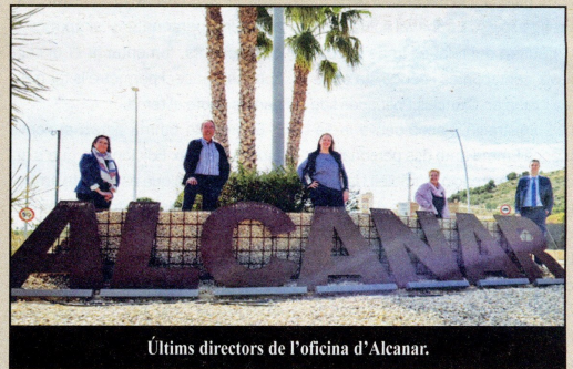
Últims directors de l'oficina d'Alcanar.