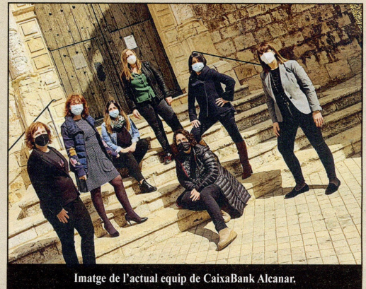
Imatge de l'actual equip de CaixaBank Alcanar.