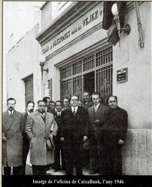
Imatge de l'oficina de CaixaBank, l'any 1946

La capillaritat de la xarxa conjunta amb les capacitats digitals - amb 10 milions de clients digitals a Espanya- permetran seguir millo-