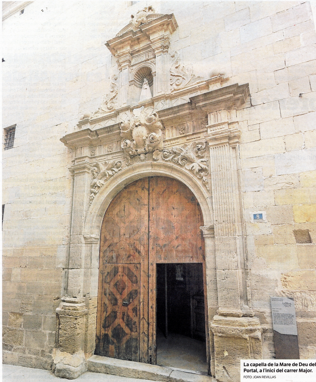
La capella de la Mare de Deu del Portal, a l'inici del carrer Major.