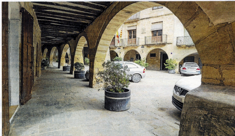
Interior del porticat, amb la casa de la Vila al fons.

ment econòmic i demogràfic de la població, sobretot durant la Guerra dels Segadors, pel fet de ser un lloc fronterer entre Aragó i València. Amb el segle XVIII torna la prosperitat econòmica i demogràfica perduda, amb un fort creixement dels conreus de la vinya, cereals, olivers i ametllers. En aquest moment s'edificaren moltes cases senyoriales, la població sobrepasa els límits de la vila closa amb un extens creixement urbà i l'inicial plaça Vella de planta triangular s'obre cap a llevant per configurar el nou espai de l'actual plaça de Catalunya.