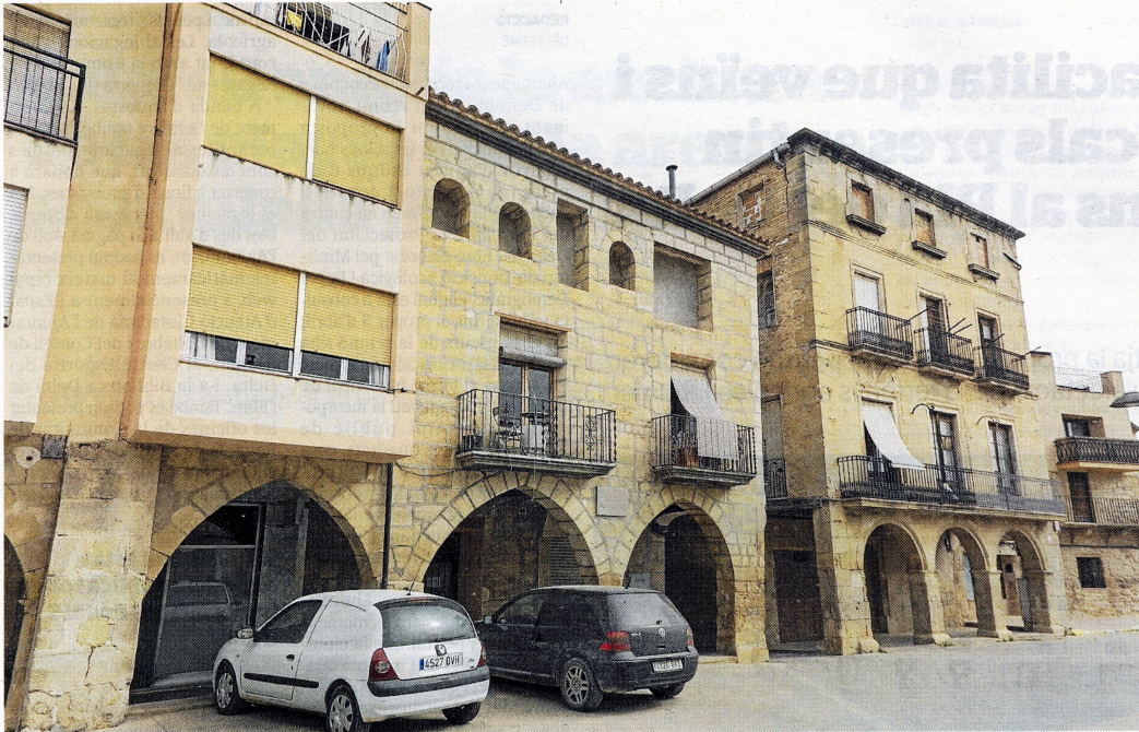
Casa vuitcentista a la cantonada amb l'antic portal de Sant Roc.