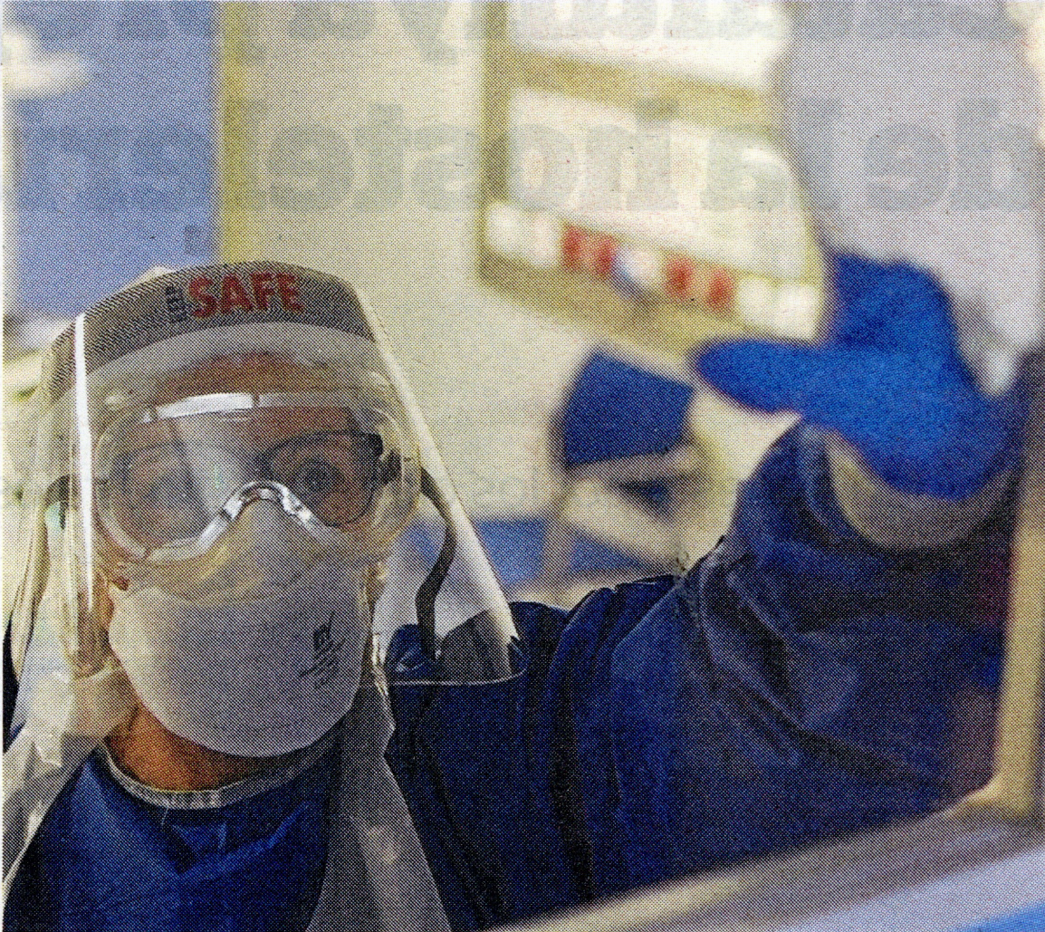
Una sanitaria durante su jornada de trabajo en la UCI del Hospital Verge de la Cinta de Tortosa.

El caso más antiguo de Covid en España es de finales de enero. Fue un paciente que viajó a Nepal y, tras su regreso a España el 30 de enero, falleció. No derivó en otros positivos.