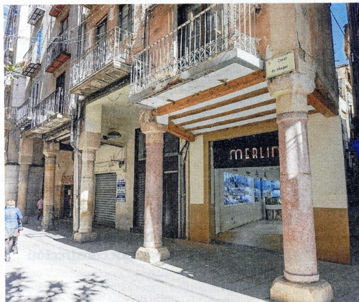
Pòrtics amb diferents alçades a cada casa.