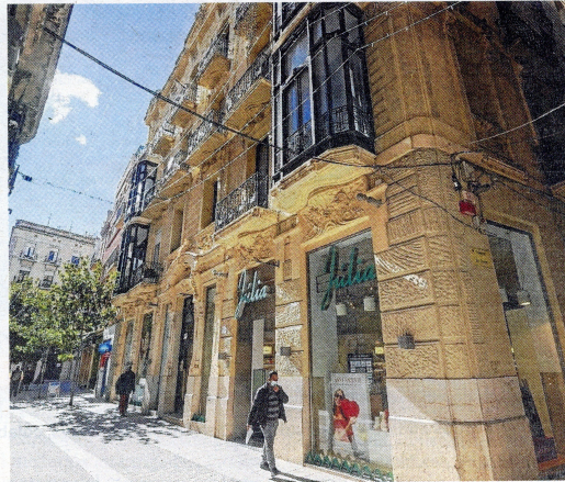
Casa Lamote de Grignon, d'estil modernista.

Teodoro González al sud, mantenint fins avui una intensa activitat comercial.