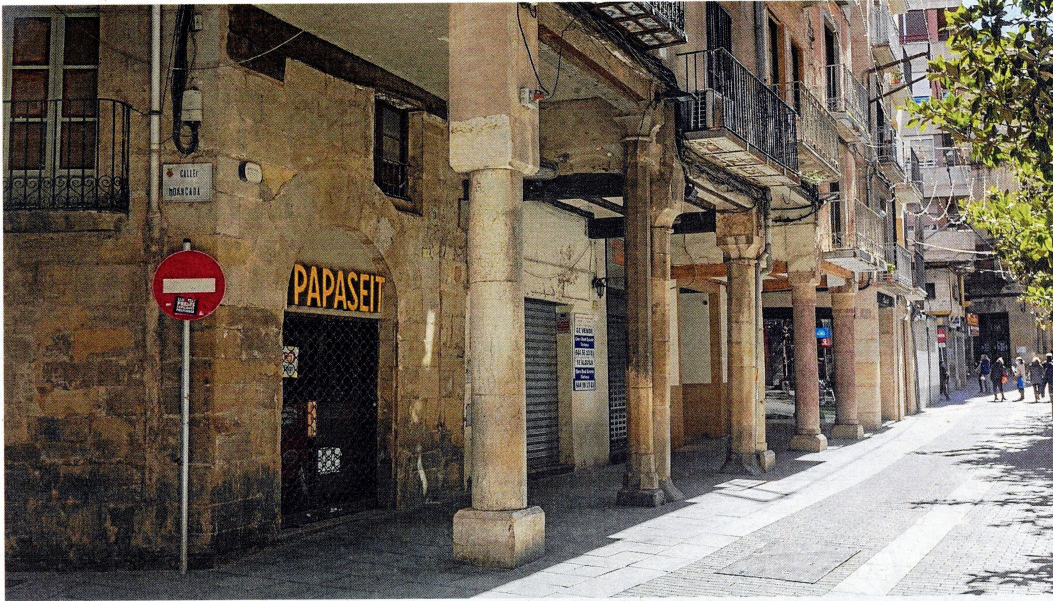
Cases porticades medievals del carrer de l'Àngel.