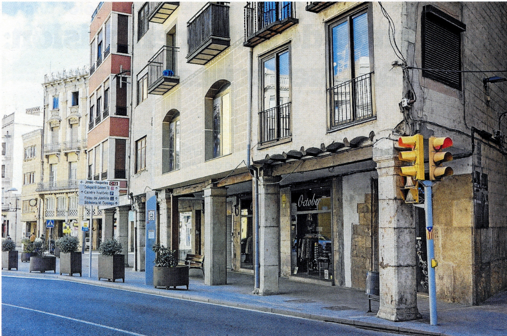
Porticat construït després de la Guerra Civil, amb el primer edifici mantenint la traça medieval.