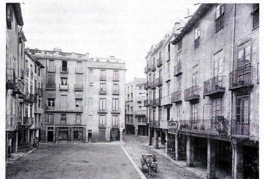
Imatge antiga de la plaça de les Cols.