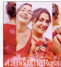
'La boda de Rosa', d'Iciar Bolaín

Teatre familiar. Ambientada al Moscou del 1957, en plena Guerra Freda i la cursa espacial, Laika -una gosseta- sobreviu pels carrers de la gelada ciutat, sense saber que el seu destí la portarà a l'espai dins la nau Spútnik i passarà a la història de la humanitat com el primer ésser viu a orbitar al voltant de la Terra.