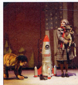
'Laika', de Cia. Xirriquiteula

És la darrera obra de William Shakespeare. L'obra s'ambienta a l'illa de Prósper, on van a parar les víctimes d'un naufragi, provocat per un personatge màgic. Sota l'aparença d'una comèdia, es reflexiona sobre les utopies i sobre quina societat bastiríem si se'n donés una segona oportunitat en una illa verge.