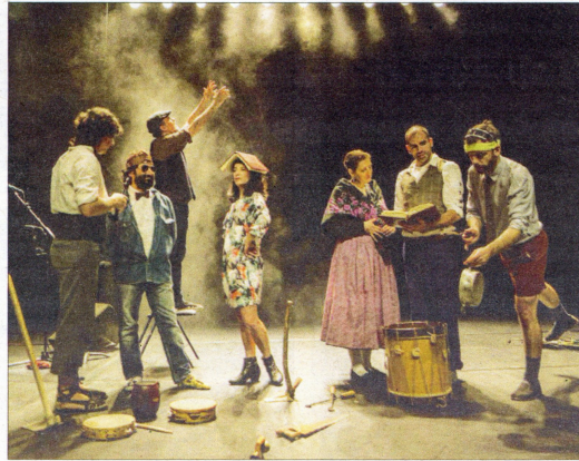
L'espectacle 'A vore', Premi Butaca a Millor Espectacle de Dansa el 2018, retorna al territori ebrenc el 30 d'abril. / L'EBRE

Els encarregats d'estrenar l'any en què Tortosa és Capital de la Cultura Catalana arribarà de la mà de Bu-