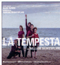
'La Tempesta', de Parking Shakespeare

El plat fort de la programació de l'Auditori Felip Pedrell arribarà de la mà de Buhos, un dels grups d'èxit del panorama musical de Catalunya, que combina rock, ska, reggae i pop. L'espectacle, dirigit per Albert Pla, proposa un mètode curatiu de l'ànima, i presentaran el seu últim disc El dia de la Victòria .