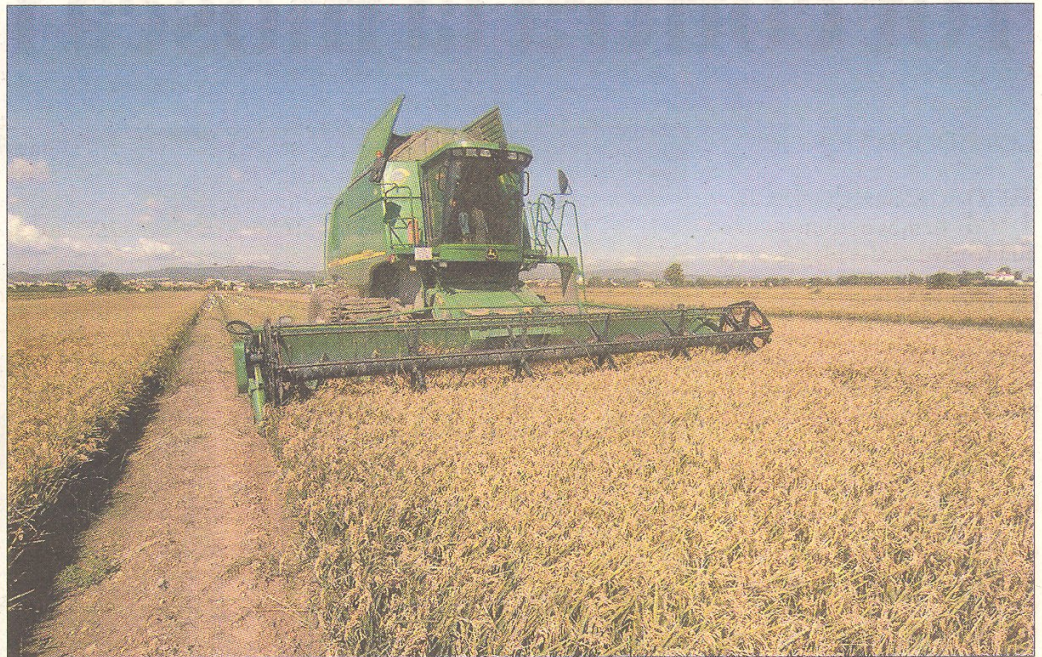
Imatge d'una segadora mentre treballa en un camp de cultiu d'arròs.

Sebastià reconeix que la iniciativa va resultar satisfactòria per als propietaris de les segadores i que la coordinació va fer