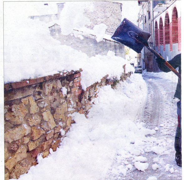
A la imatge de l'esquerra, un veí circulant pels carrers de Gandesa. A la dreta, un home netejant els carrers de Tivissa.