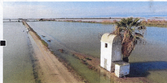
Arrossars inundats a l'illa de Buda, una altra de les zones que més pateix la regressió.