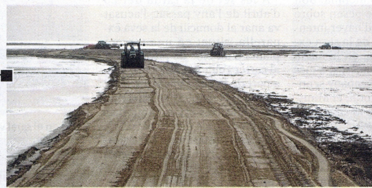
Tractors treballant per refer la barra del Trabucador, el punt més afectat fa un any.