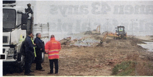
Danys del Glòria a la zona de la Marquesa i la bassa de l'Arena, a Deltebre.