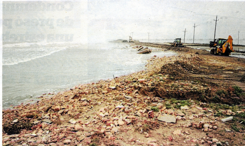
Efectes del Glòria el 22 de gener del 2020 a la Marquesa, un dels espais més fràgils.

El Govern de la Generalitat es fa seu el Pla Delta, un pla acordat per la Taula de Consens (formada pels alcaldes del delta, entitats i comunitats de regants) que es va presentar fa gairebé un any, després del pas del Glòria, amb les actuacions a curt, mitjà i llarg termini que s'haurien d'emprendre al delta per garantir-ne la supervivència. Però la Taula de Consens ha denunciat sentir-se indignada per la falta d'entesa entre el Govern i l'Estat espanyol al llarg de tot el 2020 i fins a l'actualitat. El passat dilluns el Go-