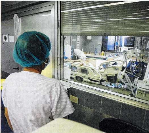
Unidad de Cuidados Intensivos en Santa Tecla.

Los hospitales catalanes registran en los últimos días una media de 100 ingresos diarios por coronavirus. Actualmente hay 2.150 personas hospitalizadas por Covid-19.