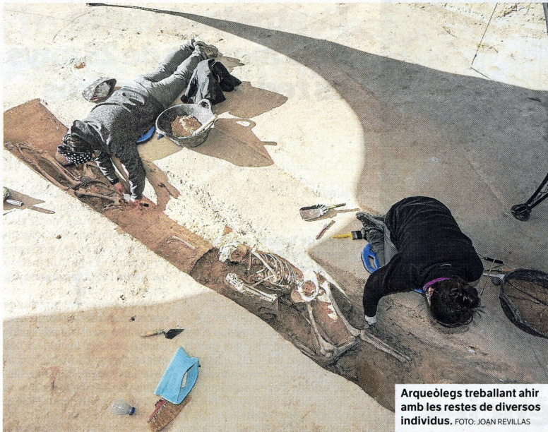
Arqueòlegs treballant ahir amb les restes de diversos individus.