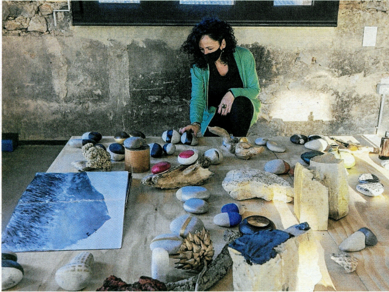
Imágenes de la exposición 'Lo que dicen las piedras' de la artista Nu Díaz que se puede visitar en Ulldecona. La creadora ha adaptado la obra escultórica al espacio expositivo del Antic Molí de Cèsar Martinell, actual Oficina de Turisme.