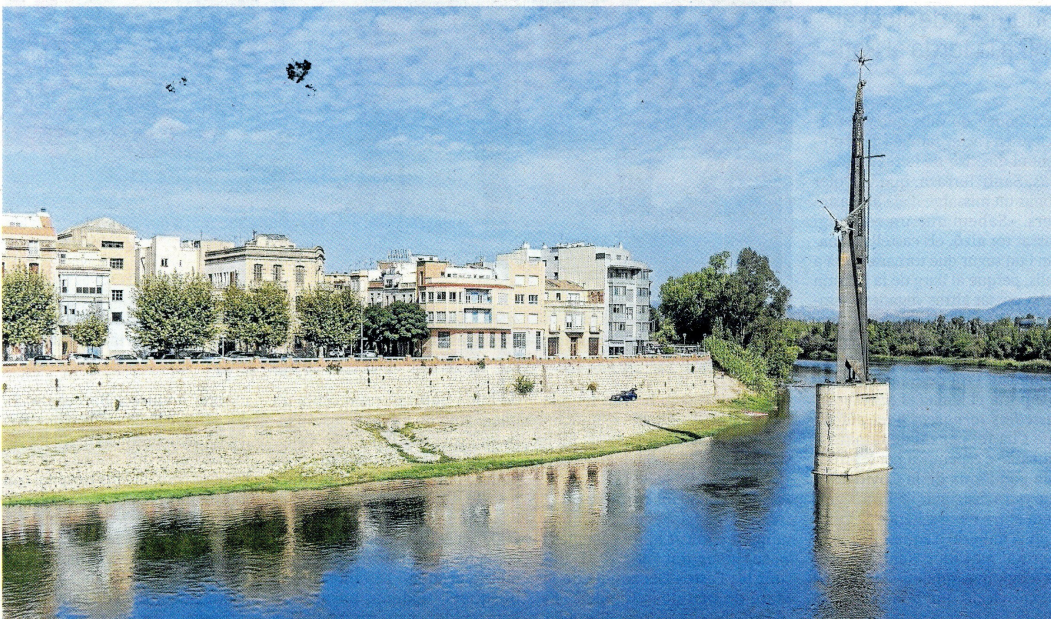
El monòlit es va construir pels 25 anys de la batalla de l'Ebre i es va inaugurar el 1966.

Tots els grups excepte Ciutadans donen suport a la modificació del catàleg. Ara és el torn de la Comissió d'Urbanisme