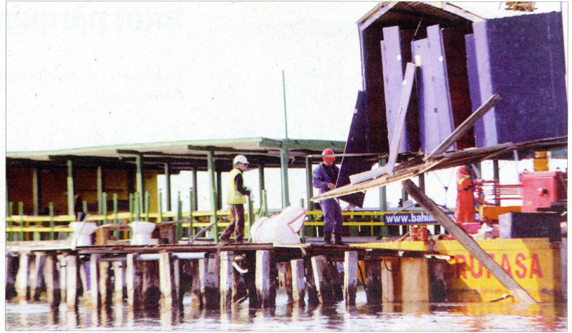
Imatge d'este dijous dels treballs per desmantellar el Xiringuito. NÚRIA CARO

Segons assenyalàvem al Setmanari l'Ebre en el seu moment, els darrers propietaris del negoci, l'empresa Bahia Mar, haurien intentat legalitzar la seua situació anys enrere, tot i no aconseguir-ho davant l'enduriment de la legislació de Costes. "Ens hem reunit amb els propietaris i els seus advocats diverses vegades, però quan hi ha una sentència judicial que diu que esta estructura no pot estar en determinat espai, sense haver-hi cap forma que siga legalitzable, s'ha