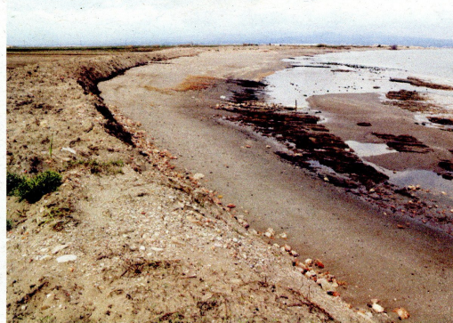
Resultat dels treballs fets a la platja de la Marquesa.