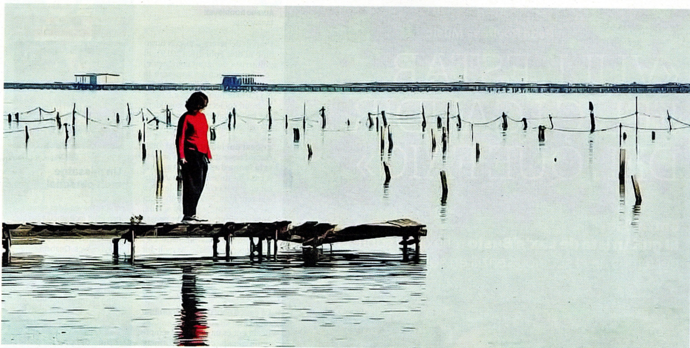
Yolanda López, pasarel·la que hi ha a la badia dels Alfacs, que es troba en un desviament de la carretera.