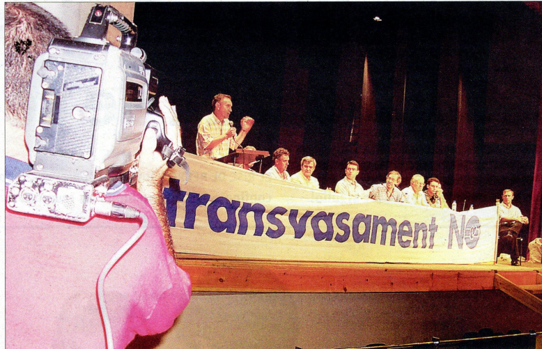
Dos imatges de l'assemblea constituent de la Plataforma en Defensa de l'Ebre, a l'auditori de Tortosa.

Aquell 15 de setembre es va constituir la Plataforma en Defensa de l'Ebre (PDE), una entitat que es podria considerar d'arrel ecologista però que s'ha convertit en una icona de la identitat ebrenc i de la seua integritat territorial i socioeconòmica. Un moviment que ha anat elabo-