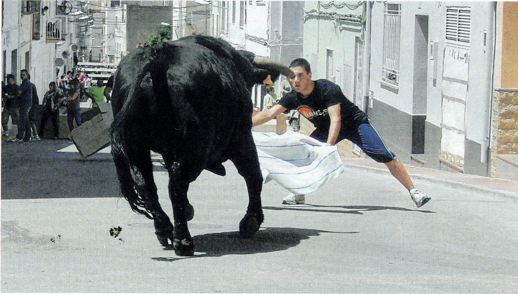
Un noi torejant un bou en unes festes a Alcanar, en una fotografia d'arxiu.