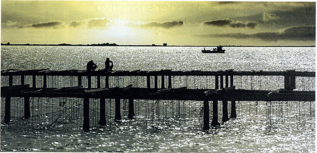
Imatge d'arxiu de la badia dels Alfacs.