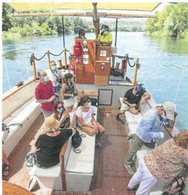
Gaudint a bord del llaüt 'Lo Roget'.

Una de les novetats són les visites per descobrir el ric passat morisc d'Ascó, a través dels petits carrerons de les tres viles closes que té el poble (la més antiga, del