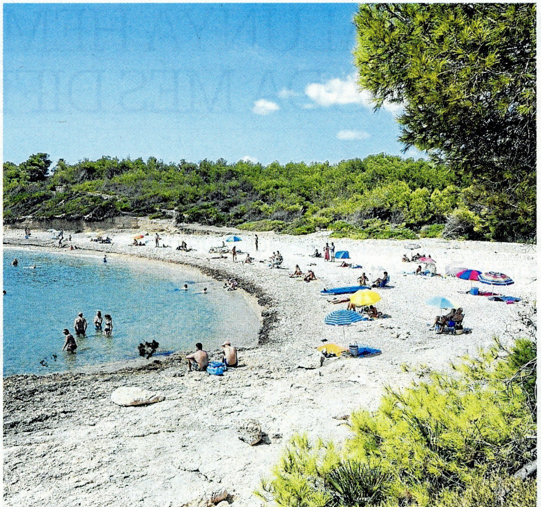
La platja Torrent del Pi de la la Cala, fa uns dies.

whatsapp o correu electrònic, entre d'altres.