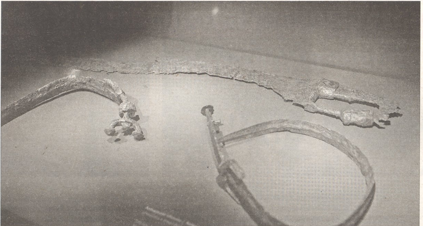
Aquesta falcata, arma ibèrica trobada al jaciment de Mianes (Santa Bàrbara), és una peça única a Catalunya.