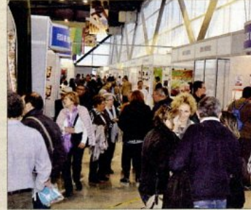
Imatge de l'edició del passat any del Mercat a la Plaça d'Amposta i de la Fira d'Expoebre de Tortosa.

ment del Perelló ha suspès l'edició de Firabril, ajornant les jornades gastronòmiques de la Mel i l'Oli, fins a nou avis i l'Abella Rock fins al 12 de juny