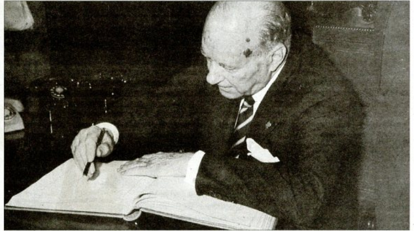
L'èxit del Consell de l'Ebre de 1978 fou la generositat de tots per a renunciar a cap protagonisme i presentar un front comú; la desunió va suposar el seu fracàs.

El president Pujol sempre va tenir reticències respecte al Consell Intercomarcal; el seu projecte polític era la creació de petits poders territorials (els consells comarcals) contro-