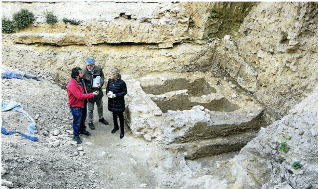
El mausoleu és de planta quadrada o rectangular i se n'han trobat pocs a l'Estat espanyol.