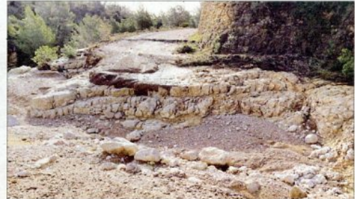
Un camí fet malbé, al terme municipal de Tortosa.