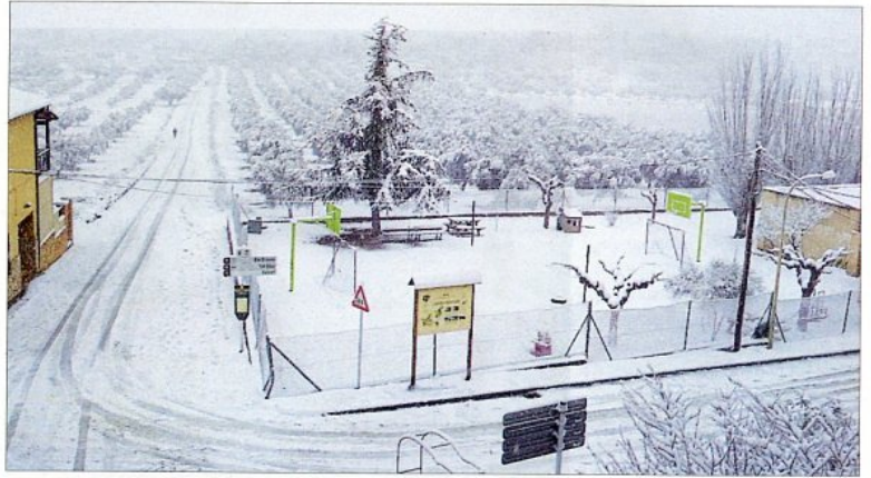
Imatge de la nevada de dilluns a Arnes.

BO PER A LA VINYA La neu sobre els camps de vinya serà beneficiosa per a la collita del proper mes de setembre. Les nevades suposen una reserva d'aigua que, un cop es desgläça, torna a regar la planta. A més, evita que s'instal·len fongs i insectes sobre l'escorça de l'arbre. Amb el fred i la neu, també s'endarrerix la brotada i es garanteix un bon inici de cicle de cara a la primavera. ■