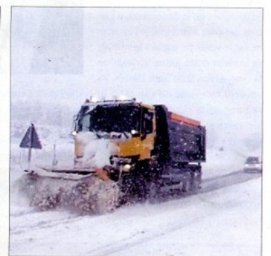
La neu va tenir de blanc la comarca de la Terra Alta. La màquina llivaneu treballant dilluns.