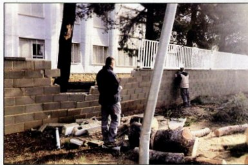
A dalt, carrers i places inundades a l'Ampolla. A baix, reparació de danys a Ulldescona. / AJUNTAMENTS I XARXES SOCIALS