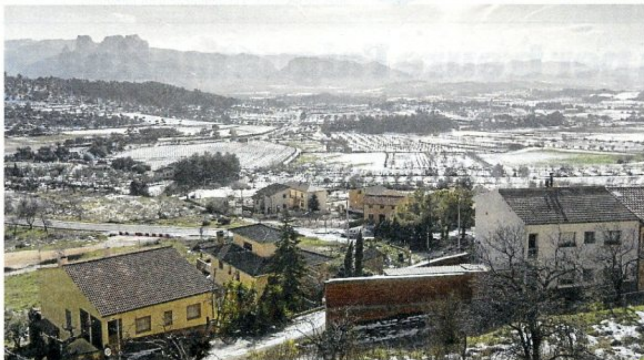
La neu ja gairebé ha desaparegut dels carrers i del paisatge d'Horta.