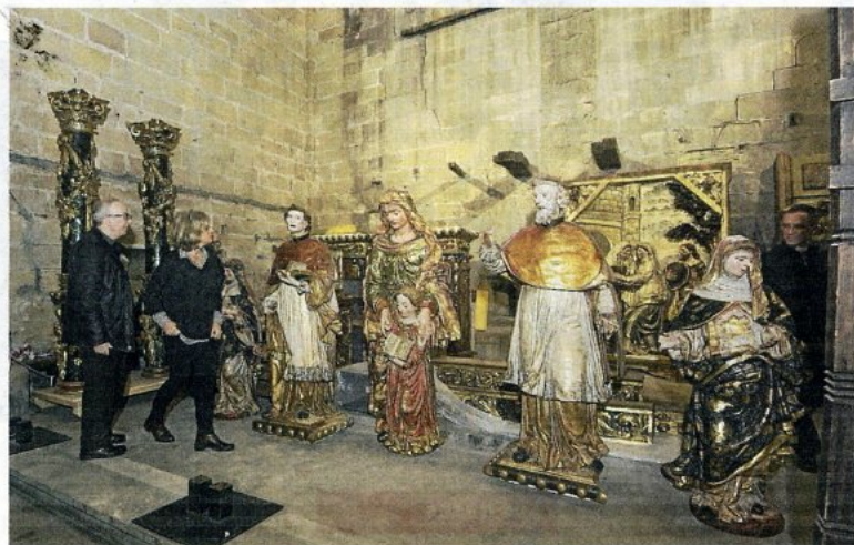
Un cop restaurat, al gener es muntarà el retaule i es consolidarà l'estructura.