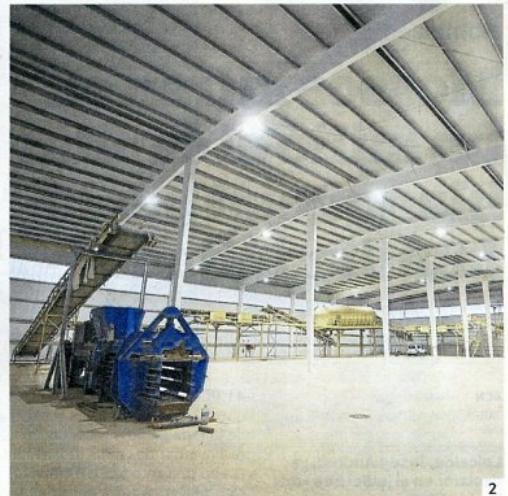
1. Imatge del vas del dipòsit, ahir a la tarda. 2. La planta de tractament del dipòsit de residus.