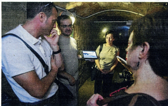
Terra Enllà en una de les rutes de memòria històrica.

Amb la plaça de davant acabada i la façana restaurada, és d'esperar que el temple i aquest nou