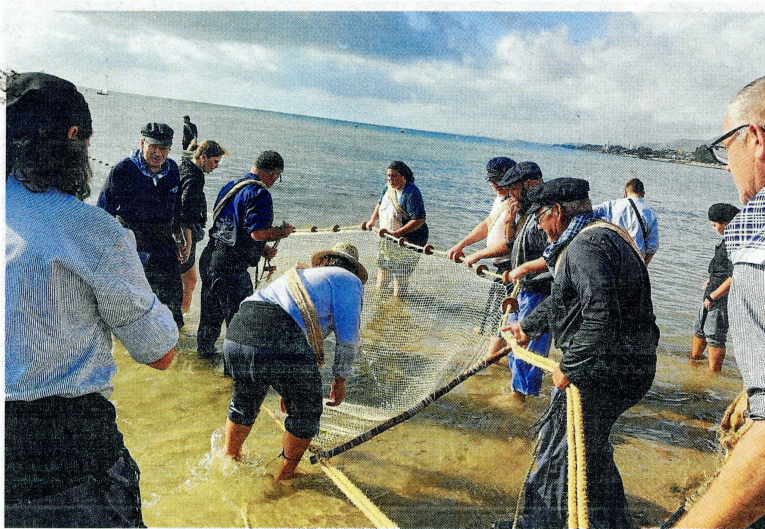
Imatge de la demostració de la calada del rossegall a la platja del Garbí, ahir.

Malgrat que una part de la població a més de marinera també era pagesa, enguany el front marítim ha pres més protagonisme a