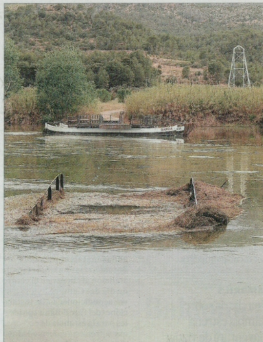
El pas de barca i l'embarcador de Garcia han patit les conseqüències de l'augment sobtat del cabal.

Sigui com sigui, la decisió del Consell de Ministres va aixecar novament polseguera entre bona part dels partits de l'oposició