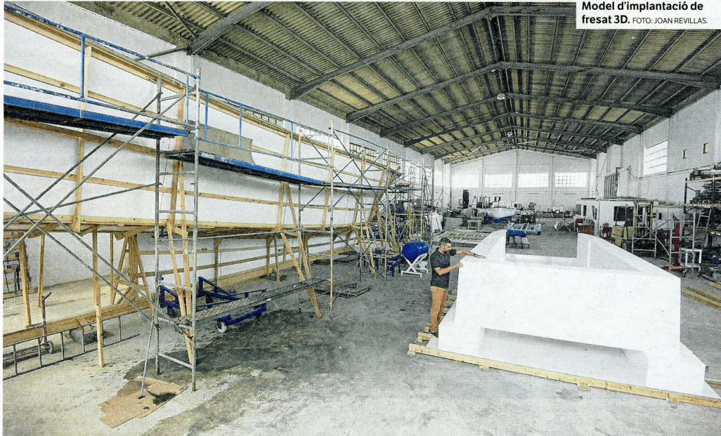
Model d'implantació de fresat 3D.