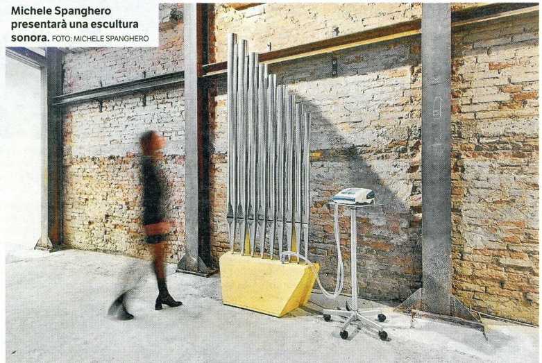
Michele Spanghero presentarà una escultura sonora.