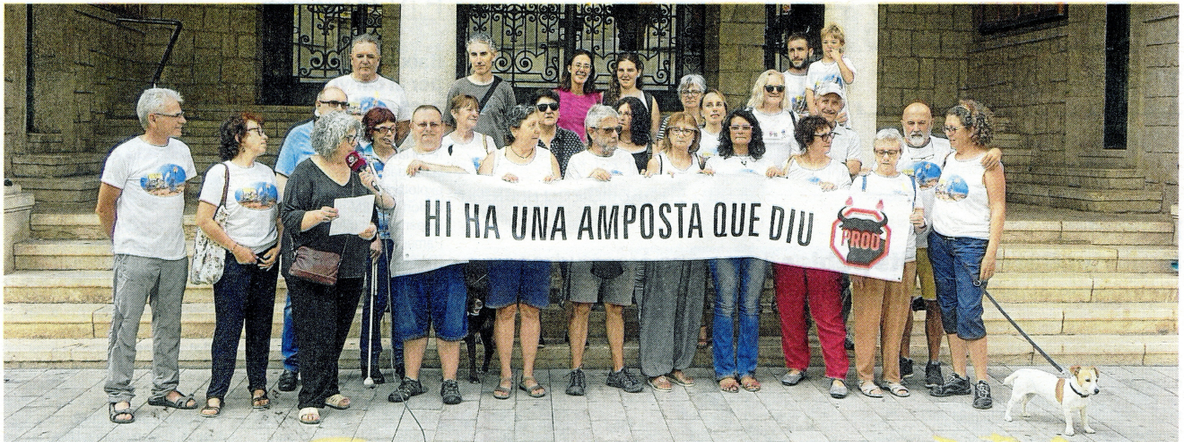
Ahir a la tarda una vintena d'integrants de l'associació es van presentar en públic davant de l'Ajuntament d'Amposta, municipi amb forta tradició taurina.