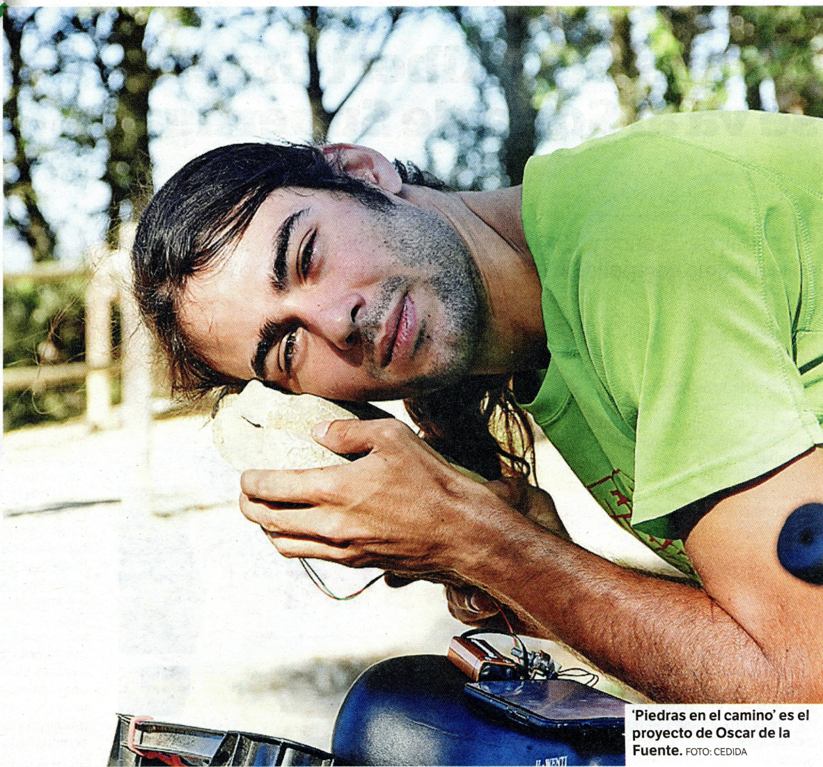
'Piedras en el camino' es el proyecto de Oscar de la Fuente.