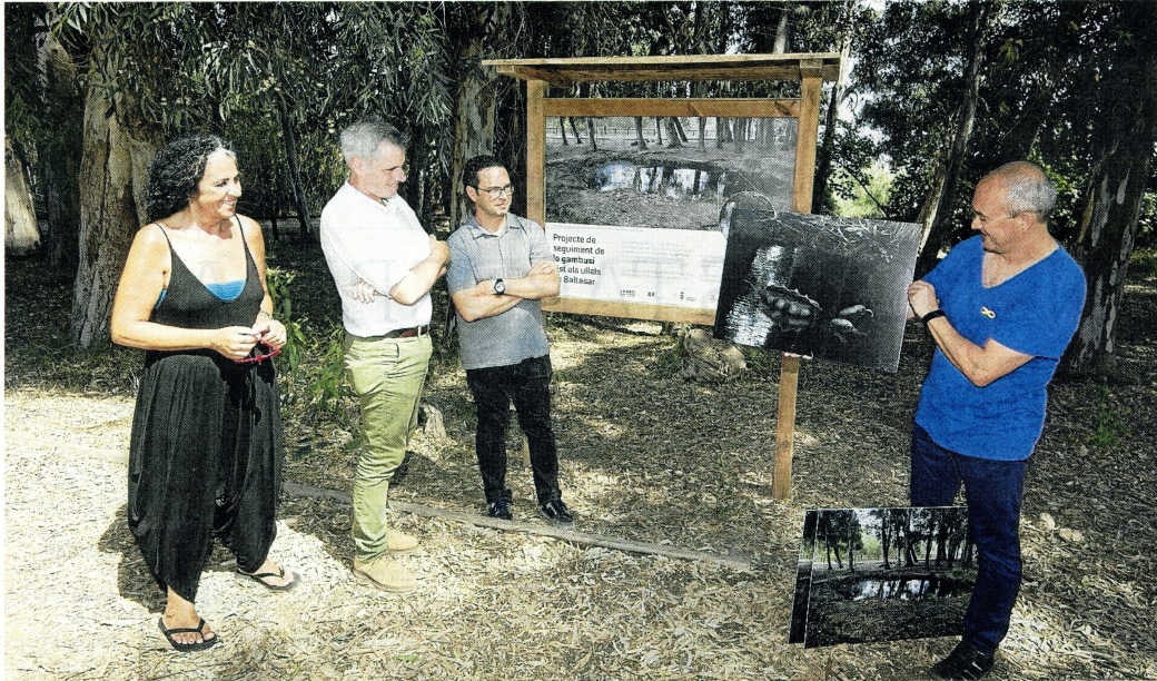
Ahir es va presentar la proposta als Ullals de Baltasar d'Amposta.