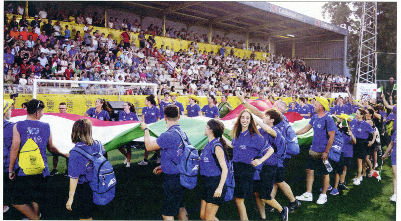
La imatge de Tortosa ha canviat en trenta anys, dels homenatges a l'Exèrcit als jocs esportius mundials per la convivència i la pau.

Tortosa ha canviat socialment i també políticament. Era una ciutat antinacionalista. Els seus dos líders durant el primer terç del segle XX (Marcel·lí Domingo i Joaquín Bau) sempre es manifestaren contra el sobiranisme català, des de l'esquerra i des de la dreta i en el seu conjunt arrasaven. A les primeres eleccions des de 1977, la ciutadania sempre votava les opcions més espanyolistes (UCD o AP/PP). Les Terres de l'Ebre eren el reducte dretà de tot Catalunya. A finals de segle va arribar el canvi que s'ha anat consolidant. El passat 26 de maig, a les eleccions municipals, 8.354 persones van votar opcions independentistes sobre 15.116 votants (el 55,67 per cent); a les eleccions al Parlament Europeu del