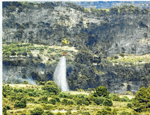
Un helicòpter remullant el terra al terme de Flix.

Els mitjans (34 vehicles autobomba, dotacions del Grup d'Accions Forestals GRAF, 3 helicòpters i vehicles de suport i comandament) intensificaven les tasques d'extinció, sobretot al terç superior del flanc dret, per poder consolidar tot el perímetre. Al llarg de la nit de dissabte a